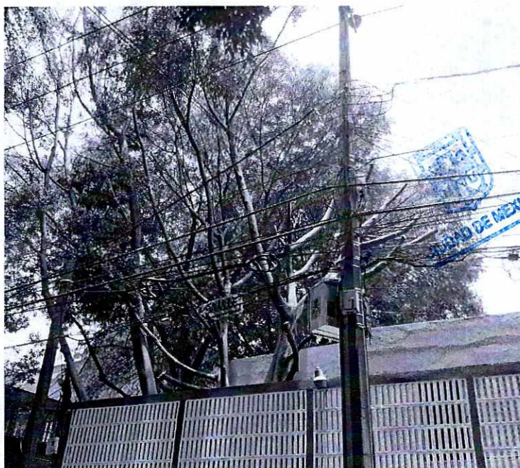
Fotografía 1. Vista del arbolado localizado en Obrero Mundial, número 623, colonia Narvarte, Alcaldía Benito Juárez.

En este sentido, de las constancias que obran en el expediente en el que se actúa, se desprende que personal adscrito a esta Subprocuraduría, se constituyó en la vía pública en Obrero Mundial, frente al inmueble número 623, de la colonia Narvarte, Alcaldía Benito Juárez, observando que al interior del inmueble se localizan dos individuos arbóreos, de la especie Ficus retusa , conocido comúnmente como Laurel de la India, mismos que presentaban cortes atribuibles a poda principalmente en sus ramas altas, los cuales, sobrepasan el 25% del porcentaje máximo permitido señalado en la Norma Ambiental para el Distrito Federal NADF-001-RNAT-2015; no obstante, se observó que su sobrevivencia no se encuentra comprometida.