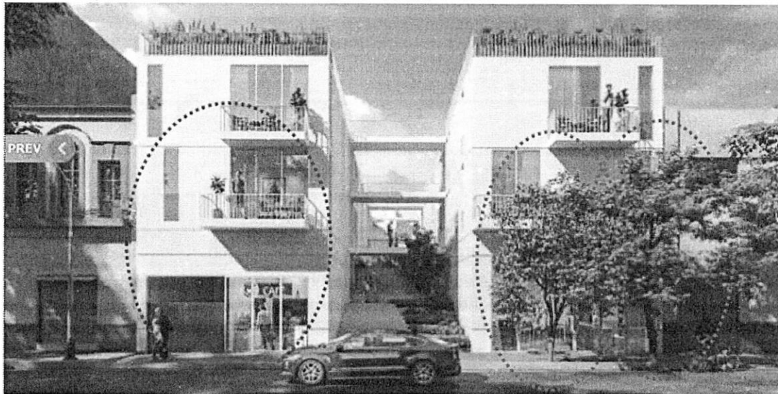
Imagen 1. Proyecto constructivo donde no se contempla un individuo arbóreo en la acera. Fuente https://www.lahaus.mx/nuevo/dr-atl-238/ciudad-de-mexico