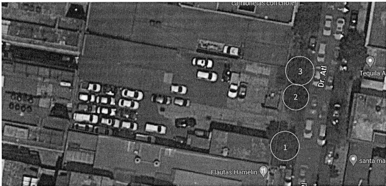
Imagen 3. Predio en planta, donde se pueden observar los tres árboles en la acera.

De lo anterior, se procede a mostrar una imagen en planta de la ubicación de los árboles antes descritos, obtenida vía google maps para una mayor referencia: -----