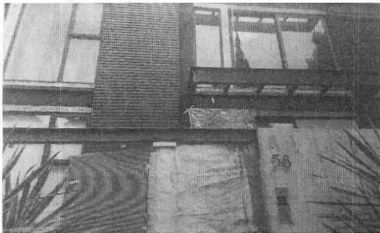
Se muestra el inmueble motivo de denuncia.

En este sentido, personal de esta Subprocuraduría llevó a cabo reconocimiento de hechos, constituyéndose frente al domicilio que nos ocupa, siendo atendido por una persona del género femenino quien una vez informada de los hechos que esta entidad investiga, refirió ser la responsable de los dos caninos referidos en la denuncia, los cuales a su dicho, fueron retirados del inmueble y reubicados en un rancho, ya que solo permanecieron alojados a un lado de la caseta de vigilancia por dos días, contando con alimento, atención médica veterinaria y un lugar donde descansar (echarse), permitiendo el ingreso al área de estacionamiento y la caseta de vigilancia para constatar su dicho, no observando caninos o indicios que pudieran indicar su presencia.