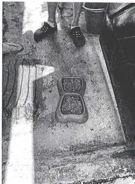
Figura 2. Recipiente con alimento