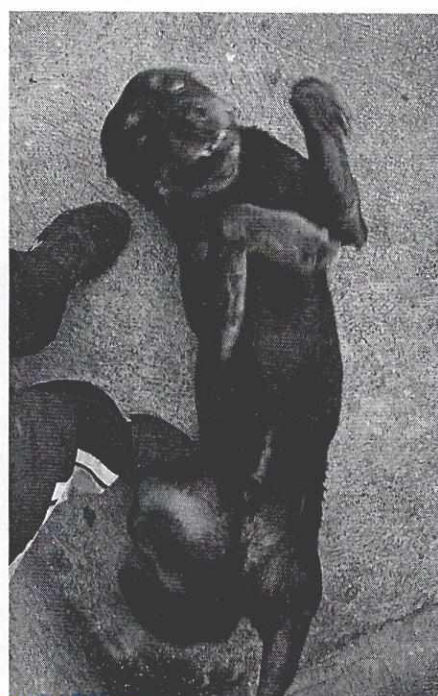
Fotografías 1 a 4. Se muestra fachada del inmueble, así como ejemplares caninos objeto de denuncia.