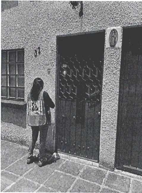
Imagen 1. Fachada del lugar de la denuncia.