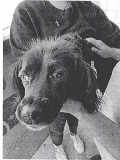
Imagen 2. Ejemplar canino motivo de denuncia.