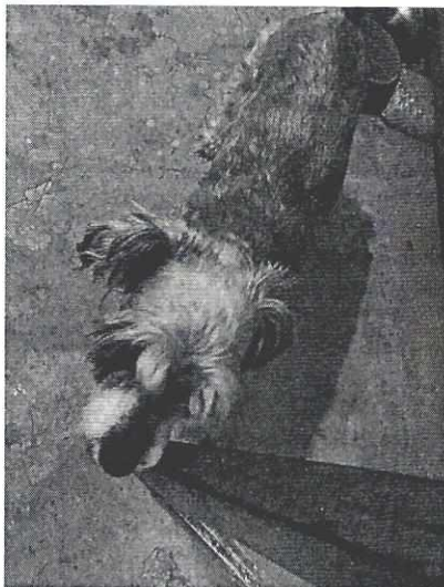
Imagen 3. Ejemplar de nombre "Lucas".