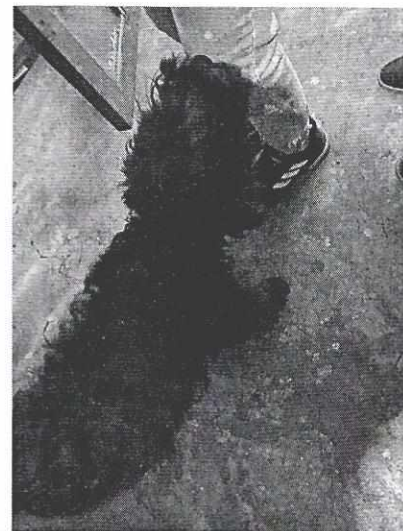
Imagen 4. Ejemplar de nombre "Negro".

Es de resaltar que, en el Acuerdo de Admisión, que fue enviado por correo electrónico a la persona denunciante, se le hizo de conocimiento que contaba con un término de seis días hábiles para aportar las pruebas que estimara pertinentes en la investigación de los hechos, lo anterior conforme al artículo 90 del Reglamento de la Ley Orgánica de la Procuraduría Ambiental y del Ordenamiento Territorial de la Ciudad de México; sin embargo durante el procedimiento de investigación, no fueron proporcionados elementos de prueba que pudieran determinar incumplimiento a la normatividad en materia de bienestar animal.