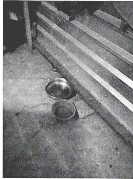
Imagen 2. Recipientes con agua.