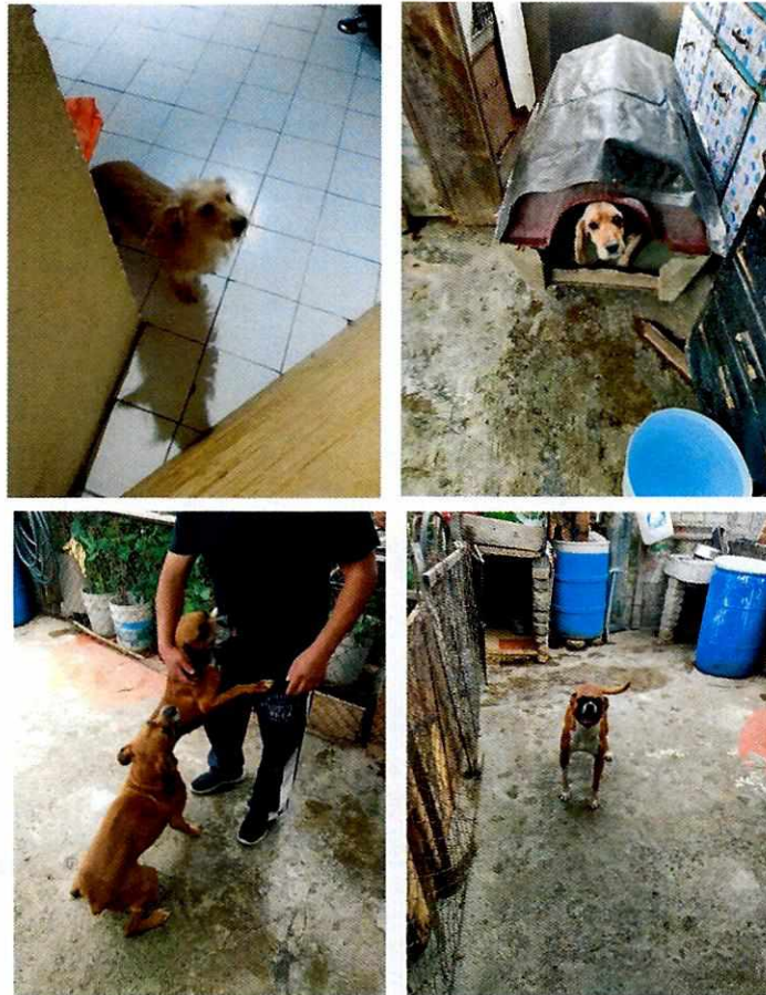
Figura Ejemplares caninos motivo de denuncia.

Es de resaltar que, en el Acuerdo de Admisión, que fue enviado por correo electrónico a la persona denunciante, se le hizo de conocimiento que contaba con un término de seis días hábiles para aportar las pruebas que estimara pertinentes en la investigación de los hechos, lo anterior conforme al artículo 90 del Reglamento de la Ley Orgánica de la Procuraduría Ambiental y del Ordenamiento Territorial de la Ciudad de México; sin embargo durante el procedimiento de investigación, no fueron proporcionados elementos de prueba que pudieran determinar incumplimiento a la normatividad en materia de bienestar animal.