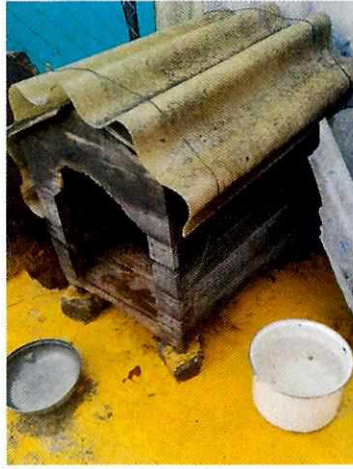
Fotografías 1 y 2. Ejemplares motivo de denuncia y sitio de alojamiento.

Es de resaltar que, en el Acuerdo de Admisión, que fue enviado por correo electrónico a la persona denunciante, se le hizo de conocimiento que contaba con un término de seis días hábiles para aportar las pruebas que estimara pertinentes en la investigación de los hechos, lo anterior conforme al artículo 90 del Reglamento de la Ley Orgánica de la Procuraduría Ambiental y del Ordenamiento Territorial de la Ciudad de México; sin embargo durante el procedimiento de investigación, no fueron proporcionados elementos de prueba que pudieran determinar incumplimiento a la normatividad en materia de bienestar animal.