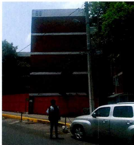
Fotografía 1. Sitio referido en el escrito de denuncia.

inmueble marcado con el número 55 corresponde a un edificio, en ese sentido, cabe señalar, que se tuvo comunicación con un vecino del lugar, quien informó no hay caninos en el edificio antes referido. Por lo anterior, se realizaron llamadas telefónicas al número proporcionado por la persona denunciante para oír y recibir notificaciones, de igual forma se le envió correo electrónico, con la finalidad de que aportara más elementos a la investigación; sin embargo, dichos requerimientos no fueron atendidos.