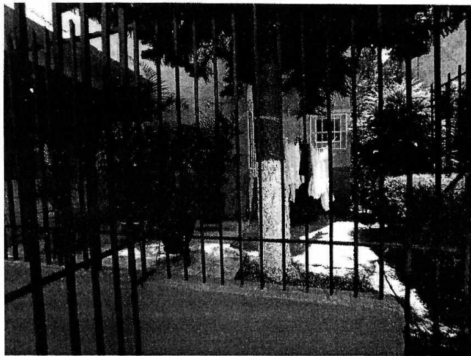
Fotografía 1. Área verde afectada.

En este sentido, de las constancias que obran en el presente expediente, se desprende que personal de esta Subprocuraduría llevó a cabo una visita de reconocimiento de hechos en el sitio señalado como el de los hechos, de acuerdo con lo establecido en el artículo 15 BIS 4 fracción IV de la Ley Orgánica de esta Entidad, diligencia durante la cual constató la presencia de una plancha de cemento de aproximadamente 10 m 2 sobre una jardinera, un individuo arbóreo de la especie Araucaria heterophylla , así como una porción de suelo descubierta y plantas ornamentales, asimismo, durante la diligencia no se constató la presencia de algún tocón.