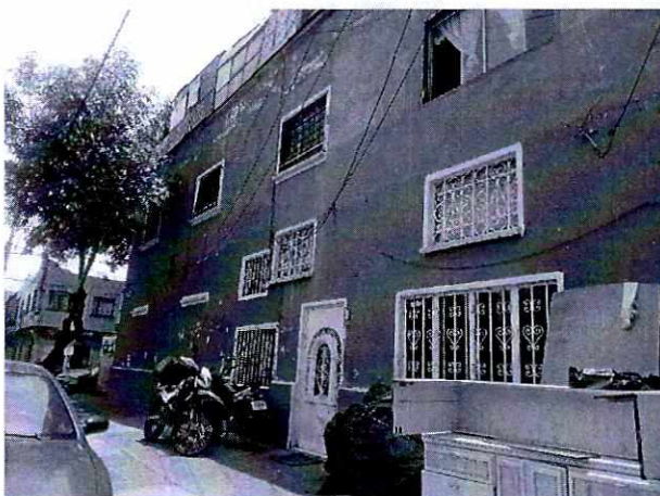
Fotografía.- vista del inmueble que se localizó durante la diligencia

Ante tal virtud, mediante oficio esta autoridad solicitó a la persona denunciante que proporcionara información que permitiera localizar el inmueble donde acontecen los hechos denunciados, con la finalidad de que el personal investigador realizara la diligencia correspondiente, sin que a la fecha del presente instrumento dicho requerimiento haya sido atendido.