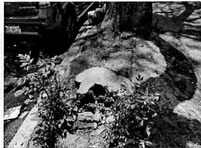
Figuras 1-7. Se observan seis tocones derivados del retiro de los individuos arbóreos, así como el lugar de donde se retiró el séptimo tocón.

En seguimiento de lo anterior, en atención a previa solicitud, mediante el oficio AGAM/DGSU/1063/19 de fecha 4 de junio del presente año, la Dirección General de Servicios Urbanos informó que derivado de la solicitud para el derribo de arbolado, localizado en el sitio de referencia, esa Dirección General emitió los dictámenes técnicos correspondientes, concluyendo procedente el derribo de siete sujetos forestales por riesgo y mejoramiento de áreas verdes, por lo cual emitió la autorización número DMU/AUTO/037/19 para su derribo.