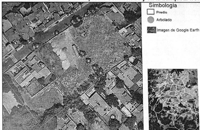
Imagen 3 – Localización del arbolado en el predio denunciado y en la banqueta frontal al mismo.