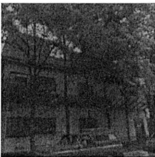
Reconocimiento de hechos 13 de mayo de 2021. Predio delimitado con tapiales de madera y demolición parcial en el tercer nivel

Por otra parte, en relación con los hechos que se investigan en la materia de construcción (demolición), como se mencionó anteriormente, personal adscrito realizó los reconocimientos de hechos en las inmediaciones del predio objeto de denuncia, diligencias en la que se constató un inmueble de 3 niveles de altura, también se observó que el techo del tercer nivel se encuentra totalmente retirado. -----