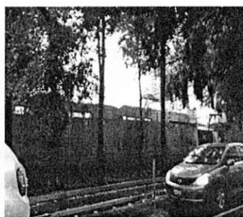
Reconocimiento de hechos 25 de junio de 2021. Predio delimitado con tapiales de madera, y demolición del tercer nivel