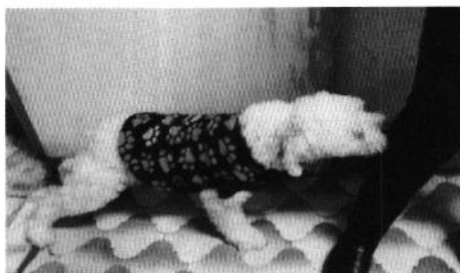
Figura 1. Ejemplares denunciados.

Es de resaltar que, en el Acuerdo de Admisión, que fue enviado por correo electrónico a la persona denunciante, se le hizo de conocimiento que contaba con un término de seis días hábiles para aportar las pruebas que estimara pertinentes en la investigación de los hechos, lo anterior conforme al artículo 90 del Reglamento de la Ley Orgánica de la Procuraduría Ambiental y del Ordenamiento Territorial de la Ciudad de México; sin embargo durante el procedimiento de investigación, no fueron proporcionados elementos de prueba que pudieran determinar incumplimiento a la normatividad en materia de bienestar animal.