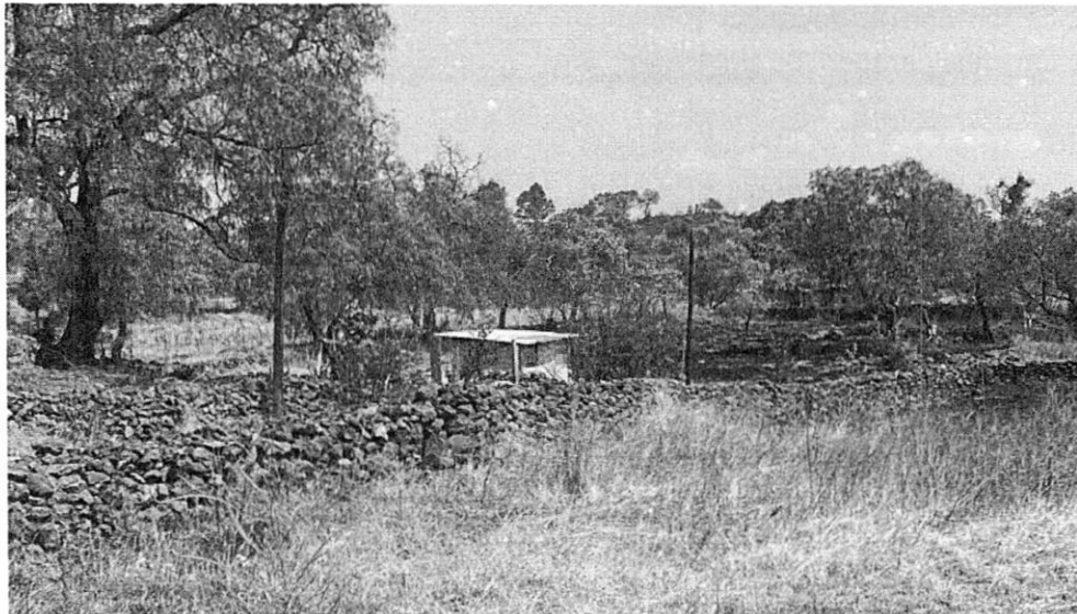
Imagen 1. Localización y registro fotográfico de visita de reconocimiento de hechos en el predio objeto de denuncia.

Sobre el particular, personal de esta Subprocuraduría se constituyó en las inmediaciones del sitio denunciado, ubicado en el Paraje Apantenco, en la zona cerril de Santa Cruz Acalpixca, Alcaldía Xochimilco en las coordenadas 491949, 2126309, en la compañía de la persona denunciante, con la finalidad de realizar el reconocimiento de los hechos denunciados, diligencia de la cual se levantó el acta circunstanciada correspondiente en la que se hizo constar que se observó una construcción en obra negra a base de tabique y cubierta de lámina. (Ver Imagen 1). -----