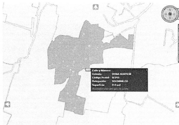
Imagen obtenida del SIG-CiudadMX de SEDUVI de poligonal de catastro del polígono correspondiente al sitio objeto de denuncia.

Adicionalmente a lo anterior, personal de esta Entidad visualizó la versión digital simplificada del Inventario de Asentamientos Humanos Irregulares, consultada en el SIG-PAOT "Sistema de Información del Patrimonio Ambiental y Urbano de la CDMX", a la cual se sobrepone la poligonal del sitio objeto de denuncia, sin que el sitio se localice dentro de algún asentamiento registrado. -----