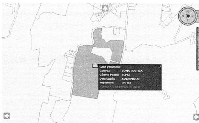
Imagen obtenida del SIG-CiudadMX de SEDUVI de poligonal de catastro del polígono correspondiente al sitio objeto de denuncia.

Adicionalmente a lo anterior, personal de esta Entidad visualizó la versión digital simplificada del Inventario de Asentamientos Humanos Irregulares, consultada en el SIG-PAOT "Sistema de Información del Patrimonio Ambiental y Urbano de la CDMX", a la cual se sobrepone la poligonal del sitio objeto de denuncia, sin que el sitio se localice dentro de algún asentamiento registrado. -----