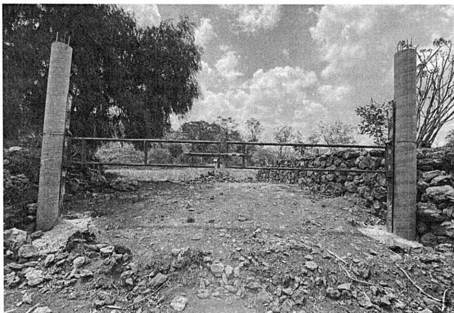
Imagen 1. Localización y registro fotográfico de visita de reconocimiento de hechos en el predio objeto de denuncia.

Sobre el particular, personal de esta Subprocuraduría se constituyó en las inmediaciones del sitio denunciado ubicado en el Paraje Quimixtepec, en la zona cerril de Santa Cruz Acalpixca, Alcaldía Xochimilco en las coordenadas 492050, 2126276, en compañía de la persona denunciante, con la finalidad de realizar el reconocimiento de los hechos denunciados, diligencia de la cual se levantó el acta circunstanciada correspondiente en la que se hizo constar que se observaron dos postes circulares, mismo que sirven de soporte para un pasador de barra, de un predio que está delimitado con muros de piedra braza, sin que al momento de la diligencia se observara alguna actividad constructiva en proceso que presuma que sea para uso habitacional. (Ver Imagen 1). -----