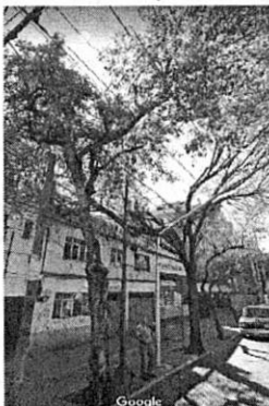
Google Maps-Street View. Enero 2019. Se observa un predio con 2 niveles de altura y 4 individuos arbóreos al frente.

En este sentido, personal adscrito a esta Subprocuraduría realizó un estudio multitemporal usando la base cartográfica de Google maps con su herramienta Street view y comparando las imágenes proporcionadas por la persona denunciante, levantando el acta circunstanciada correspondiente, se hace constar que frente del predio denunciado, existen 4 individuos arbóreos adultos y en pie de la especie ficus aparentemente, de los cuales las copas de dos individuos arbóreos fueron desmochados, dejando únicamente el fuste a una altura de 2.5 metros aproximadamente y los otros dos fueron podados. -----