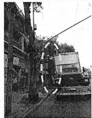
Imágenes proporcionadas por la persona denunciante en fecha 12 de abril de 2022. Se observa personal de obra podando los individuos arbóreos ubicados frente al predio de mérito.