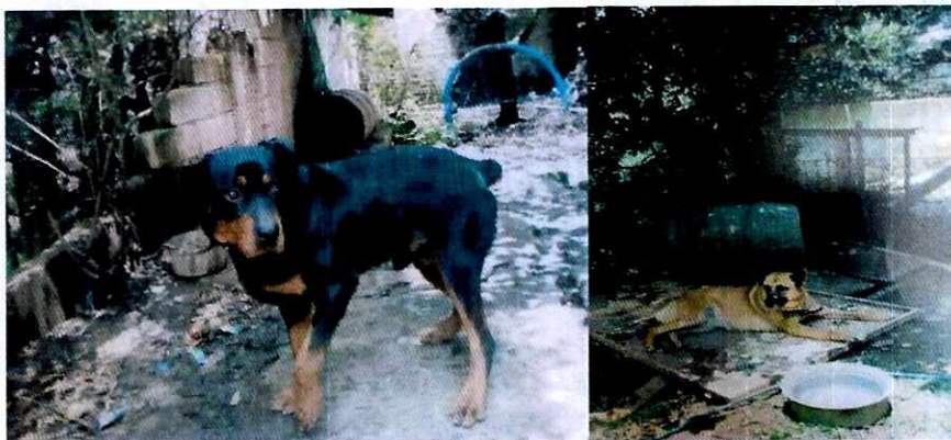
Fotografías.- Ejemplares caninos motivo de la denuncia.

Finalmente, mediante oficio se hizo del conocimiento de la persona responsable de los ejemplares caninos objeto de investigación, las repercusiones en la salud así como estado mental y el comportamiento de los animales que permanecen atados por largos períodos de tiempo, así como las responsabilidades administrativas y penales que se tienen que cumplir al tener animales de compañía, conminándola a su debido cumplimiento.