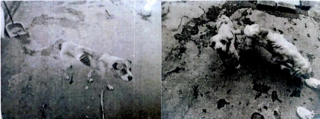
Fotografías: Ejemplares caninos motivo de la denuncia, en los cuales se observa pobre condición corporal.

Por lo anteriormente referido el personal adscrito a esta Subprocuraduría promovió el cumplimiento voluntario por parte de la persona responsable de los ejemplares caninos, por lo que durante el último reconocimiento de hechos personal veterinario de esta entidad constató: