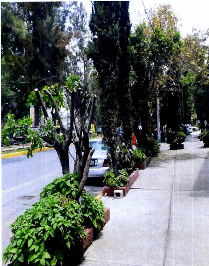
Fotografía 1. Vista de los árboles motivo de investigación.

Aunado a lo anterior, la Norma Ambiental para el Distrito Federal NADF-001-RNAT-2015, establece los requisitos y especificaciones técnicas que deberán cumplir las personas físicas, morales de carácter público o privado, autoridades, y en general todos aquellos que realicen poda, derribo, trasplante y restitución de árboles en el Distrito Federal (actual Ciudad de México).