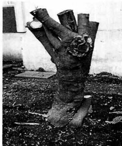
Fotografía 1. Vista del sujeto arbóreo afectado.

En este sentido, personal de esta Subprocuraduría realizó visita reconocimiento de hechos de acuerdo a lo establecido en el artículo 15 BIS 4 fracción IV de la Ley Orgánica de esta Entidad, diligencia durante la cual se constató que al interior de la unidad habitacional de comento, se llevó a cabo el desmoche de un sujeto arbóreo, lo cual puso en riesgo su supervivencia, siendo que dichas acciones se encuentran contempladas en los ordenamientos antes señalados; adicionalmente, se constató la poda de un organismo vegetal de la especie comúnmente conocida como floripondio, especie que, de acuerdo a lo previsto por la Norma Ambiental NADF-006-RNAT-2016, es considerada un arbusto, por lo que no le son aplicables los preceptos anteriormente citados.