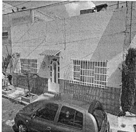
Google maps octubre 2014