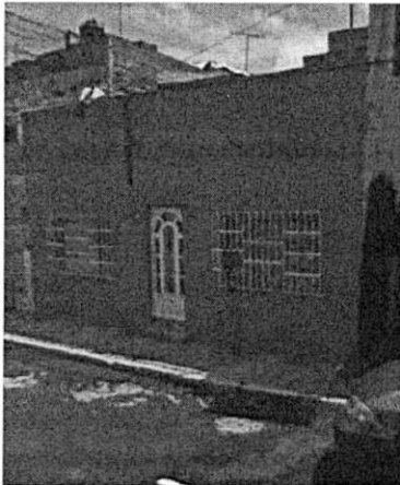
Google maps septiembre 2008