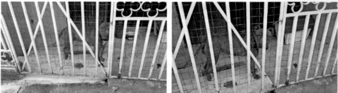
Vistas del 23 de octubre de 2014

En el lugar de alojamiento se observó una casa para perros considerablemente pequeña para el tipo de raza de la que se trata, un recipiente con alimento sólido (croquetas) y una cubeta con agua para beber. Sin embargo, se observaron heces fecales en el lugar cuya consistencia permitiría señalar que el ejemplar canino en comento se encontraba enfermo.