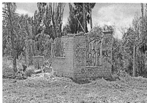
Imagen 1 y 2. Localización y registro fotográfico de visita de reconocimiento de hechos en el predio objeto de denuncia.