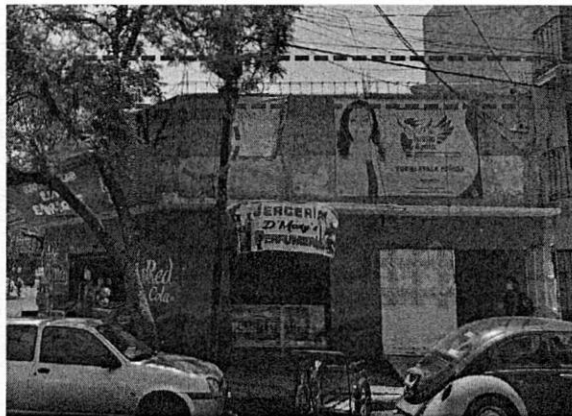
Reconocimiento de hechos de fecha 17 de mayo de 2022

Es importante señalar, que el artículo 47 del Reglamento de Construcciones de la Ciudad de México, establece que, para construir, ampliar, reparar o modificar una obra o instalación de las señaladas en el artículo 51 de este ordenamiento, el propietario o poseedor del predio o inmueble, en su caso, el Director Responsable de Obra y los Corresponsables, previo al inicio de los trabajos debe registrar la manifestación de construcción correspondiente. -----