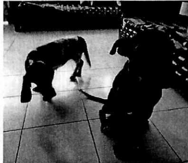
Se muestra a los ejemplares caninos motivo de denuncia.

En virtud de lo anterior, se recomendó a la responsable de los ejemplares caninos en cuestión, proporcionarles atención medica veterinaria, con la finalidad de que los caninos aumentaran su condición corporal, así como mejorar las condiciones de alojamiento en el balcón y proporcionarles agua limpia a libre acceso, por lo que en un posterior reconocimiento de hechos realizado por personal adscrito a esta unidad administrativa, se constató que el ejemplar canino de raza Basset hound, actualmente presenta una condición corporal (3/5) acorde a su talla y mientras que a dicho de su responsable, el canino de raza pitbull fue dado en adopción, asimismo se observó un recipiente con agua limpia para beber y el balcón cuenta con una jaula techada con un plástico para protegerlo de la intemperie; sin embargo, es de señalar que su responsable mencionó que no todo el tiempo el canino se encuentra en el balcón, ya que cuando llueve o hace mucho sol se ingresa al inmueble.