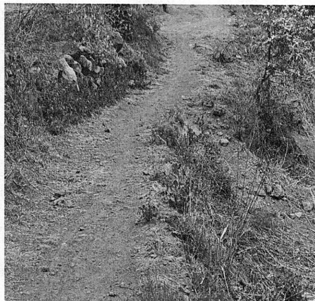
Imagen 2.- Camino que da acceso a las viviendas en la parte alta de cerro.