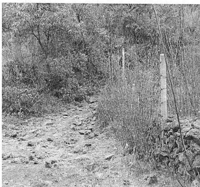
Imagen 1.- Camino que da acceso a las viviendas en la parte alta de cerro.

con la finalidad de realizar el reconocimiento de los hechos denunciados, diligencia de la cual se levantó el acta circunstanciada correspondiente en la que se hizo constar que se observó la apertura de un camino que da acceso a diversas viviendas habitadas que se encuentran en la parte alta. Durante la diligencia no se constataron actividades de derribo de arbolado, ni de extracción de cubierta vegetal. (ver Imagen 1 y 2).-----