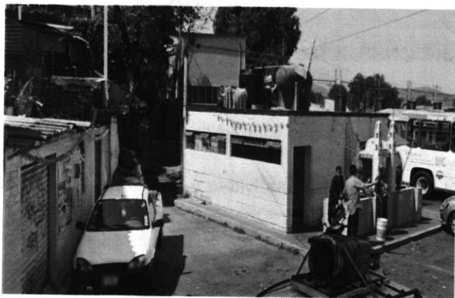
Consulta realizada por personal de PAOT

No obstante lo anterior, personal de esta Subprocuraduría realizó consulta al programa Google Maps utilizando la herramienta denominada Street View constatando que en que en febrero de 2018 el inmueble investigado contaba con características diferentes al inmueble constatado durante el reconocimiento de hechos realizado por el personal de esta Subprocuraduría, por lo que se concluye que se llevó a cabo una modificación estructural como a continuación se muestra. -----