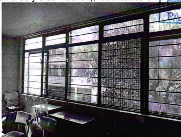
Fotografía 2. Vista del sitio en el cual se encuentran los ejemplares felinos.

Por lo tanto, concluyéndose que con las acciones realizadas por la persona responsable de los animales motivo de las denuncias, se cumple con las condiciones adecuadas de bienestar respecto al alimento, agua, higiene, movilidad, alojamiento y comportamiento. Por lo anterior se da por concluida la investigación de conformidad con el artículo 27 fracción VII de la Ley Orgánica de esta Procuraduría.