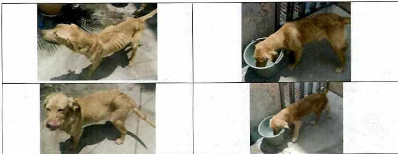
Los cuatro ejemplares caninos motivos de denuncia.

Por lo antes expuesto, el personal actuante en dicha diligencia hizo la recomendación de brindar atención medico veterinaria a todos los animales, priorizando la del ejemplar canino labrador.