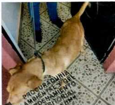
El canino labrador aumento su condición corporal.

En este sentido, en fechas 6 de julio y 4 de agosto, ambos de 2019, personal médico veterinario adscrito a esta entidad se constituyó nuevamente en el domicilio denunciado, constatando en el último en mención que el ejemplar canino labrador aumentó su condición corporal; asimismo, se encontró sin signos de lesiones o enfermedades.