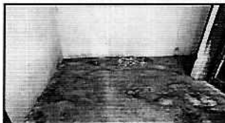
Imagen. (Izquierda) Ejemplar canino que responde al nombre de "Teddy". (Derecha) Cuarto que sirve de alojamiento del ejemplar canino.