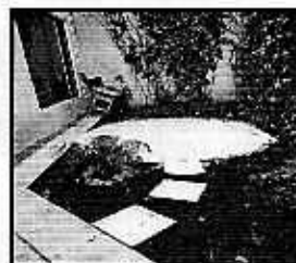
Imagen. Recipiente en el que se le proporciona agua y patio en el que se desplaza el canino.