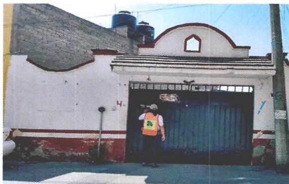
Imagen 1. Fachada del domicilio referido en la denuncia

En este sentido, de las constancias que obran en el presente expediente, se desprende que personal de esta Subprocuraduría llevó a cabo una visita de reconocimiento de hechos, de acuerdo a lo establecido en el artículo 15 BIS 4 fracción IV de la Ley Orgánica de esta Entidad, diligencia durante la cual una persona habitante del lugar donde se denunciaron los hechos objeto de la presente investigación, hizo de conocimiento al personal adscrito a esta Subprocuraduría que el ejemplar canino que fue señalado en el escrito de la denuncia, no se encuentran en el domicilio, lo anterior toda vez que nunca han tenido caninos. Cabe señalar que el personal de la PAOT constató que efectivamente no había algún ejemplar canino al interior del domicilio en cuestión.