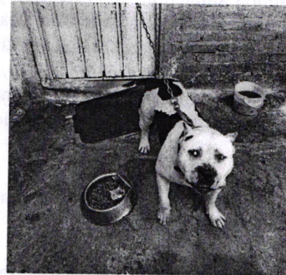
Fotografía 1 y 2. Vista del ejemplar canino con condición corporal ideal.