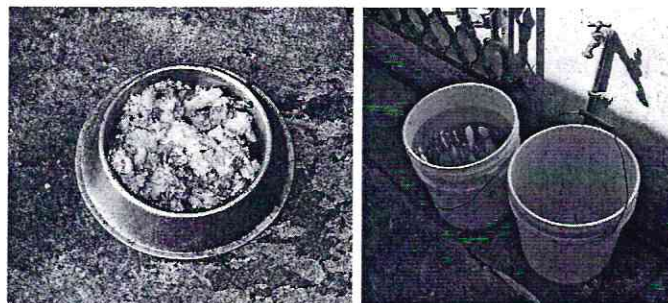
Imagen 4. Recipientes de alimento y agua.

En virtud de lo antes expuesto, esta Entidad considera procedente emitir la presente resolución de conformidad con el artículo 27 fracción VI de la Ley Orgánica de esta Entidad, por improcedencia legal, al no constatar irregularidades en materia de bienestar animal.