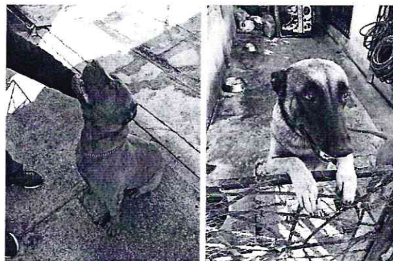
Imagen 2. Ejemplares caninos motivo de denuncia.