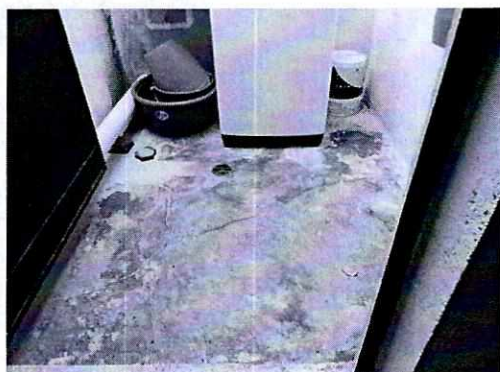
Fotografía 3. Se observa el lugar limpio.