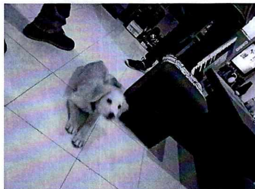
Fotografía 1 y 2. Vista del ejemplar canino motivo de denuncia