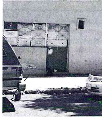
Fotografías 2, 3, 4, y 5 Se muestra en vía pública los ejemplares felinos sin hogar

Al respecto, en seguimiento a la investigación, mediante oficio PAOT-05-300/210-1628-2019 se le solicitó a la persona denunciante proporcionara información adicional, que permitiera a esta Entidad constatar los hechos de maltrato animal que motivaron la denuncia, para lo cual se le concedió un plazo de 5 días hábiles, sin embargo, una vez transcurrido el término establecido, en el expediente en el que se actúa, no obran mayores elementos, para identificar actos, hechos u omisiones de maltrato o crueldad animal.