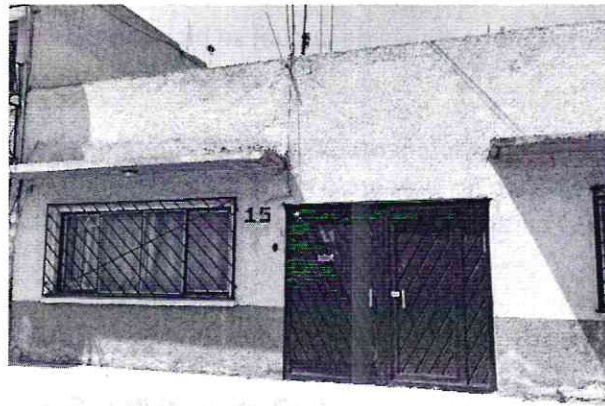
Fotografía 1 Se muestra el sitio referido en el escrito de denuncia.

Cabe señalar, que durante la diligencia personal de esta Entidad, constató que en la vía pública frente al inmueble marcado con el número 13, existían cuatro ejemplares felinos, con una condición corporal ideal (3/5) y no presentaban signos de estrés o agresión. La propietaria del predio, comentó que los gatos no tienen un hogar, y se acercan a su negocio por comida y agua, asimismo otros vecinos los alimentan y cubren los gastos de vacunas.