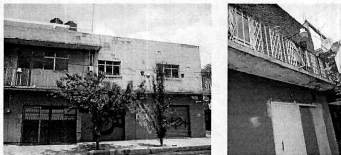
Fotografías 1-2. Vista de la fachada del inmueble motivo de denuncia.

En este sentido, de las constancias que obran en el presente expediente, se desprende que personal de esta Subprocuraduría cito a comparecer al habitante del domicilio señalado como lugar de los hechos en el escrito de denuncia, por lo que durante comparecencia el habitante manifestó que en ese domicilio no tienen algún ejemplar canino. Por lo anterior personal adscrito a esta Entidad llevó a cabo una visita de reconocimiento de hechos, de acuerdo a lo establecido en el artículo 15 BIS 4 fracción IV de la Ley Orgánica de esta Entidad, diligencia en la cual se realizó un recorrido en el interior del inmueble en mención, donde no se constató la presencia de algún perro, aunado a que no se percibieron indicios que señalaran su existencia como lo son ladridos, olores característicos o artículos para su cuidado.