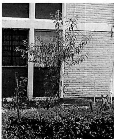
Figuras 1-2. Se observan los dos individuos arbóreos motivo de denuncia.