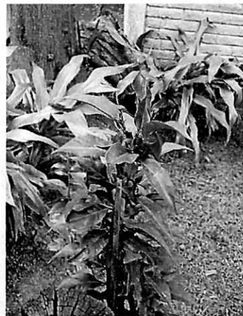
Figuras 3-4. Se observa el árbol de aguacate que ha recuperado su follaje, así como la planta ornamental colocada en el sitio como compensación.