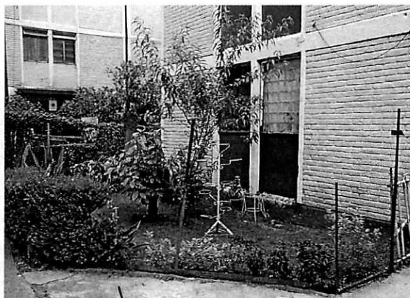
Figura 5. Se observa el estado actual del área verde donde se encuentran los individuos arbóreos motivo de denuncia.