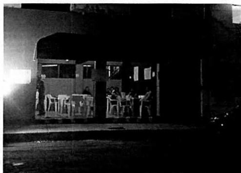
Fotografía 1. Se observa el establecimiento denominado "El Relax".

En este sentido, personal adscrito a esta Procuraduría llevó a cabo dos visitas de reconocimiento de hechos en atención a lo establecido en el artículo 15 BIS 4 fracción IV de la Ley Orgánica de esta Entidad, diligencias durante las cuales se constató que el establecimiento motivo de denuncia se encontraba abierto y en funcionamiento, percibiendo desde la vía pública emisiones sonoras provenientes de dicho lugar. Por lo anterior, se citó a comparecer en las oficinas que ocupa esta Subprocuraduría a la encargada del establecimiento en mención, quien durante comparecencia informó que los días lunes, martes, miércoles, sábados y domingos laboran en un horario de 14:30 a 22:00 horas, mientras que los jueves y viernes de 14:30 a 02:00 horas del día siguiente, manifestando que derivado del conocimiento de la presente investigación, llevaron a cabo la reubicación de la bocina empleada para la reproducción de la música grabada.