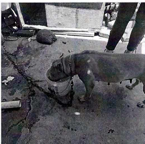
Fotografía 3. Se observa la correa con una longitud más larga.