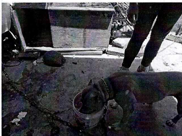
Fotografía 4. Se muestra el recipiente de agua.

Derivado de lo anterior, y no quedando actuaciones pendientes por parte de esta Subprocuraduría Ambiental, de Protección y Bienestar a los Animales para el caso que nos ocupa, se procede a dar por concluida la investigación de la denuncia ciudadana bajo el número de expediente citado al rubro, con fundamento en el artículo 27 fracción VII de la Ley Orgánica de la Procuraduría Ambiental y del Ordenamiento Territorial de la Ciudad de México.