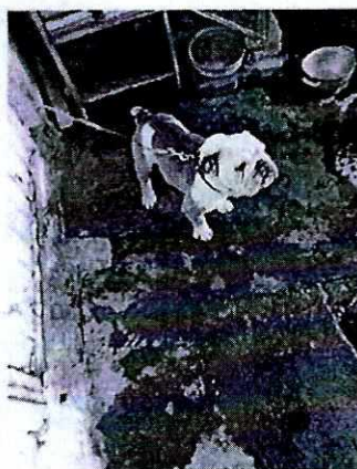
Fotografía 1 y 2. Vista de los ejemplares caninos motivo de denuncia.