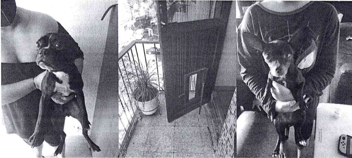
Fotografías.- Vista de los ejemplares caninos que habitan en el inmueble motivo de la denuncia.

Respecto a su estancia en el balcón, se pudo evidenciar que tienen libre acceso a el, por lo que pueden entrar y salir libremente ya que cuentan con una puerta pequeña, la cual se encuentra siempre abierta, es de referir que el balcón tiene protección para evitar algún accidente.