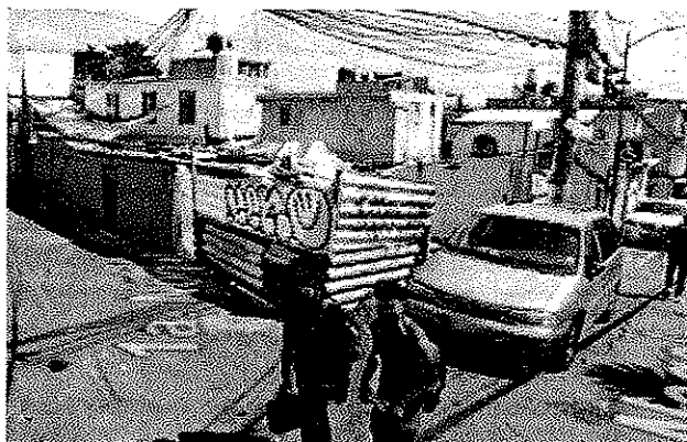
Octubre de 2022

De lo anterior se desprende que entre los años 2019 y 2022 se realizó la demolición de los inmuebles preexistentes y parte del muro que delimitada el predio, así como la construcción de dos inmuebles de dos niveles de altura.