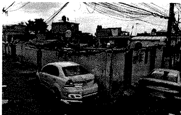
Julio de 2019 Google Maps