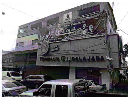
Fotografía 1. Vista del sitio referido en el escrito de denuncia

En este sentido, personal de esta Subprocuraduría realizó visita de reconocimiento de hechos de acuerdo a lo establecido en el artículo 15 BIS 4 fracción IV de la Ley Orgánica de esta Entidad, en el cual desde el espacio público no se constató la generación de emisiones sonoras por la reproducción de música pregrabada que fueran susceptibles de medición acústica.