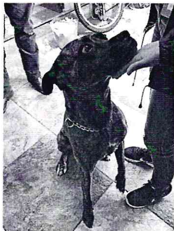
Imagen 1. Ejemplar canino motivo de denuncia.

En este sentido, personal de esta Subprocuraduría realizó una visita de reconocimiento de hechos de acuerdo a lo establecido en el artículo 15 BIS 4 fracción IV de la Ley Orgánica de esta Entidad, en la cual se constató la existencia de un ejemplar canino, macho de 3 años, de raza mestiza, de color atigrado, de talla grande, que responde al nombre de "Lucky", tiene una condición corporal ideal, el lugar de estancia y resguardo del ejemplar es todo el patio trasero que cuenta con espacio techados y la azotea en donde sube y baja a voluntad, sitios que se observaron limpios, y en ambos lugares cuenta con un recipiente de agua limpia a libre acceso, es alimentado con croquetas dos veces al día, y su comportamiento es responsivo sin muestras de estrés, el propietario del ejemplar mencionó que cuenta con atención médica veterinaria, mostrándonos sus cartillas de vacunación y desparasitación las cuales son adecuadas a su edad.