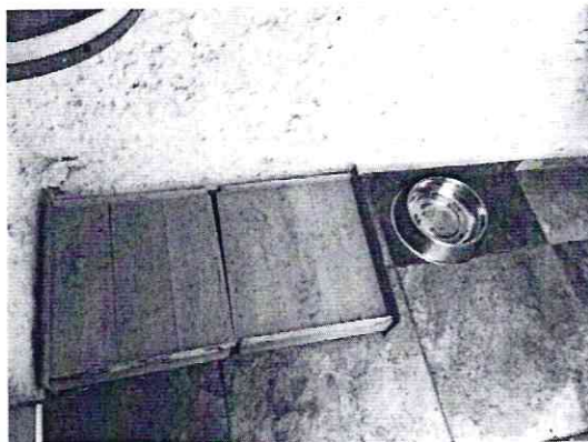
Imagen 4. Lugar de reguardo.

En virtud de lo antes expuesto, se considera procedente emitir la presente resolución, de conformidad con el artículo 27 fracción VI de la Ley Orgánica de esta Procuraduría, por imposibilidad legal, al no constatar irregularidades en materia de bienestar animal, toda vez que se han realizado todas las acciones previstas en la Ley y su Reglamento para la atención de la denuncia.