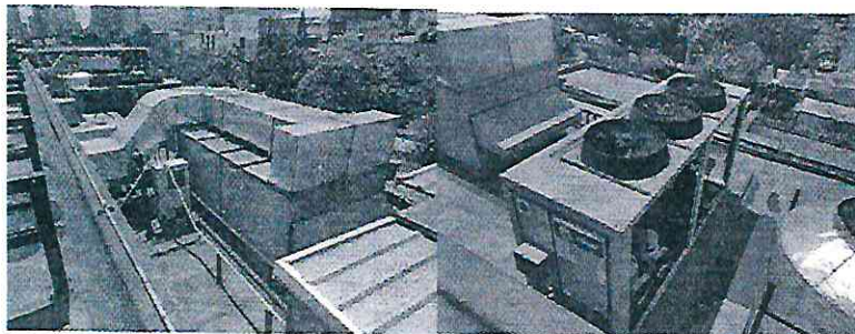
Imagen 3 y 4 sistema de aire acondicionado y ventiladores.

En seguimiento a la presente investigación, la persona denunciante informó a esta Subprocuraduría que los hechos motivo de denuncia dejaron de presentarse, toda vez que la afectación motivo de denuncia bajó de intensidad.