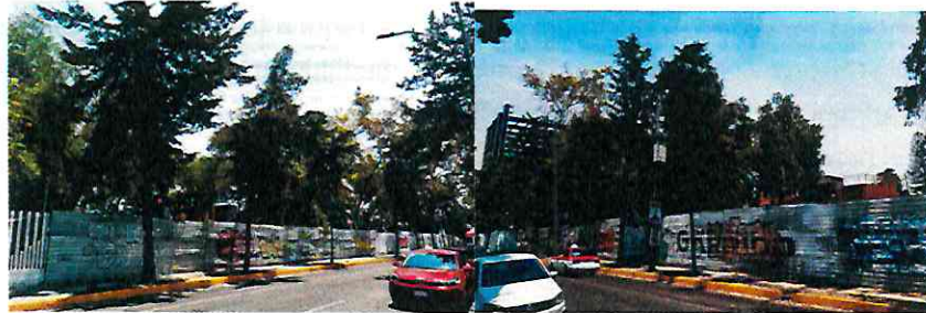
Fotografía 3 y 4, vista general del área de interés.

Derivado de lo anterior, con la finalidad de corroborar si al interior del predio de mérito hubo derribos de arbolado; se identificaron imágenes dentro del programa informático Google Earth , seleccionando las imágenes más nítidas, de mayor resolución y representativas del problema que se analiza; tomando en cuenta las fechas 29/03/2019 y 13/04/2020, se identificó y delimitó el predio, observando una disminución de cubierta vegetal para el año 2020 en el interior del mismo, tal como se muestra en las imágenes adjuntas.