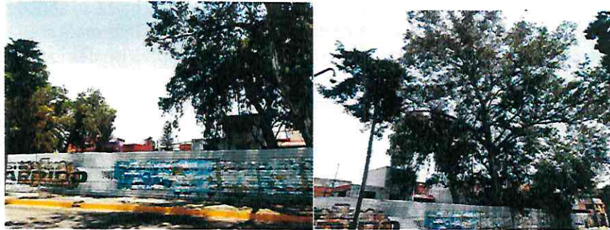
Fotografía 1 y 2, se observa un tramo sin cubierta vegetal.

No. de Folio: PAOT-05-300/200- 83 13 -2022