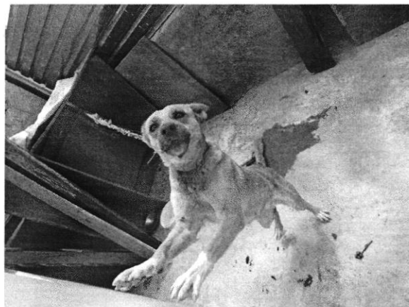
Fotografía 3.- muestra la correa del ejemplar alargada. Fotografía 4.- muestra al ejemplar con condición corporal ideal.

Derivado de lo anterior, y no quedando actuaciones pendientes por parte de esta Subprocuraduría Ambiental, de Protección y Bienestar a los Animales para el caso que nos ocupa, se procede a dar por concluida la investigación de la denuncia ciudadana bajo el número de expediente citado al rubro, con fundamento en el artículo 27 fracción VII de la Ley Orgánica de la Procuraduría Ambiental y del Ordenamiento Territorial de la Ciudad de México.