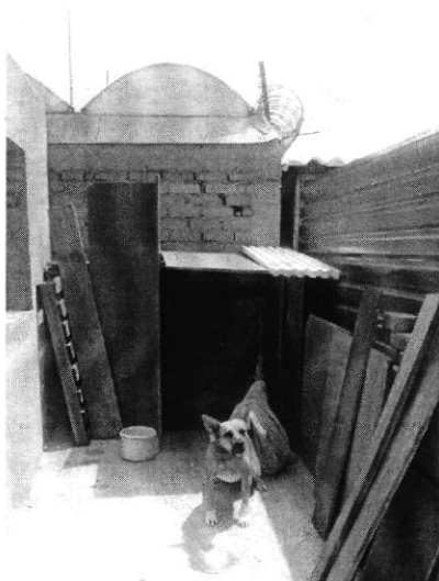
Fotografía 1. Vista del ejemplar canino.