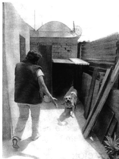
Fotografía 2. Muestra el lugar de alojamiento limpio.