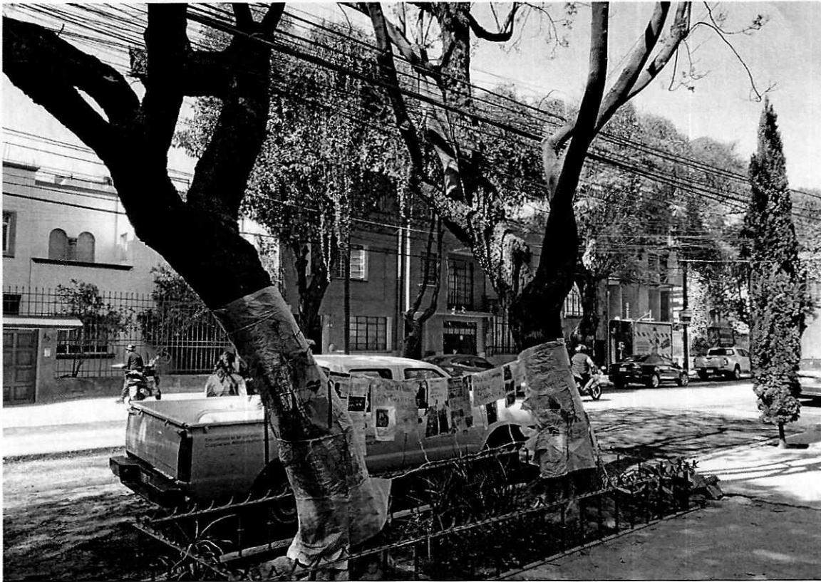
Fotografía 1. Vista de los árboles motivo de denuncia.

Al respecto, la Ley Ambiental de Protección a la Tierra en el Distrito Federal, en su artículo 118 establece que para realizar la poda, derribo o trasplante de árboles se requiere de autorización previa de la Alcaldía respectiva, sustentada mediante un dictamen técnico que avale la factibilidad del derribo, poda o trasplante; en ese sentido, durante la visita de reconocimiento de hechos realizada por personal de esta Entidad, se constató la presencia de dos individuos arbóreos de los comúnmente conocidos como jacarandas, frente al domicilio de mérito, árboles que de acuerdo al dictamen técnico elaborado por esta Subprocuraduría presentan estructura susceptible de mejora y condición general declinante incipiente.